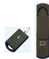
スマート@ ICハンドル ・ ICキー