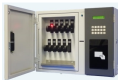
スマート@ ICキーターミナル (指静脈リーダー タイプ)