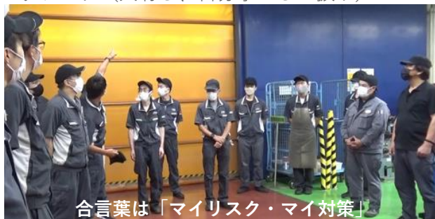
合言葉は「マイリスク・マイ対策」