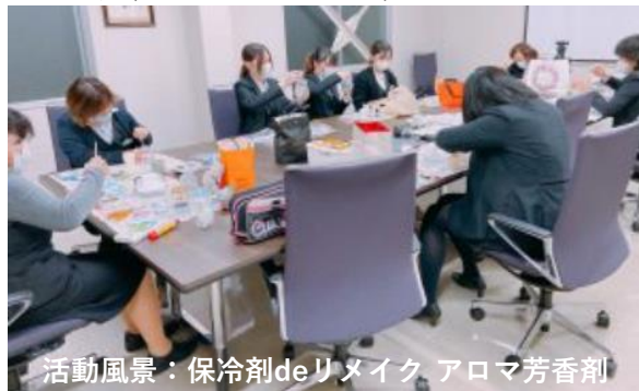
活動風景：保冷剤deリメイク アロマ芳香剤