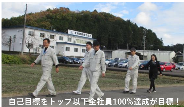
自己目標をトップ以下全社員100%達成が目標！